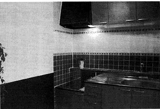
▲スライド式ドアで間仕切り変更可能 ▶ドアでデザイン性をプラス

「デザイン性が高く、ほかにないオリジナルな物件ならば、将来的にも高い賃料を維持していけると考えています。この物件も周辺より少し高めの設定になりますが、既に入居が決まっています」